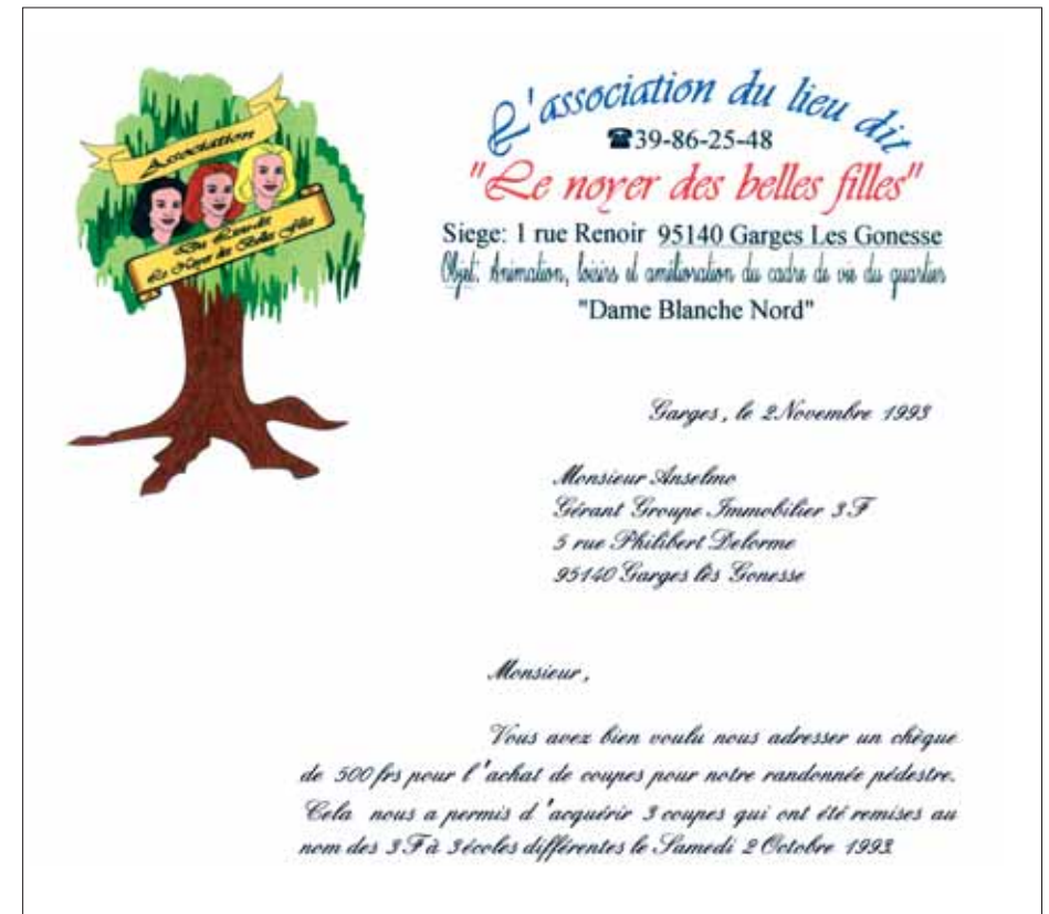
Courrier de l'Association du noyer des belles filles.

Les archives des associations sont aussi une part essentielle du patrimoine local. Comment pourrait-on écrire l'histoire des villes en ignorant les centaines d'associations qui, chacune à leur façon, ont joué un rôle dans l'éducation, les logements, les loisirs, l'action sociale, et tant d'autres domaines de la vie locale ? Les habitants d'aujourd'hui et de demain doivent pouvoir connaître le passé de leur ville, et l'histoire des associations en est indissociable.