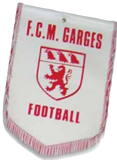
Fanion du Club multisports de Garges.

Petits ou grands, ces objets offrent un témoignage concret et souvent émouvant des valeurs et des événements qui ont marqué une association.