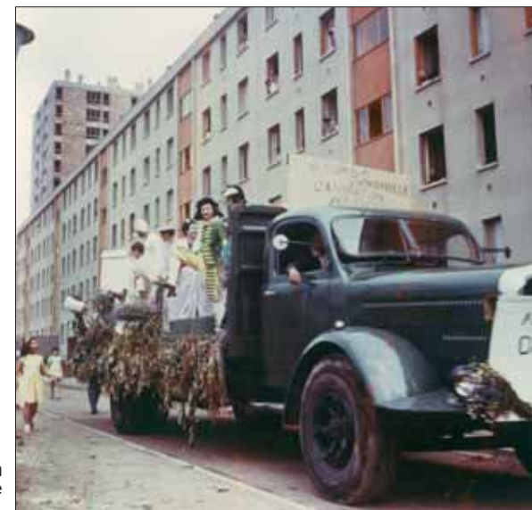
A Garges, départ de l'Association animation Dame Blanche pour le corso d'Arnouville, vers 1962.