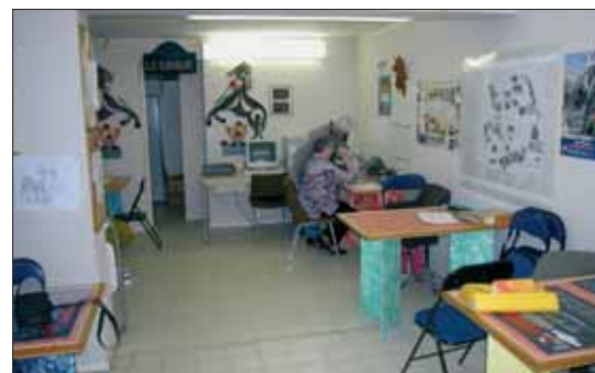
Local de l'Association du noyer des belles filles, 2005.

Il convient de noter pour chaque photographie à quelle date elle a été réalisée, dans quel lieu, à quelle occasion (fête de la ville, carnaval...), qui y figure.