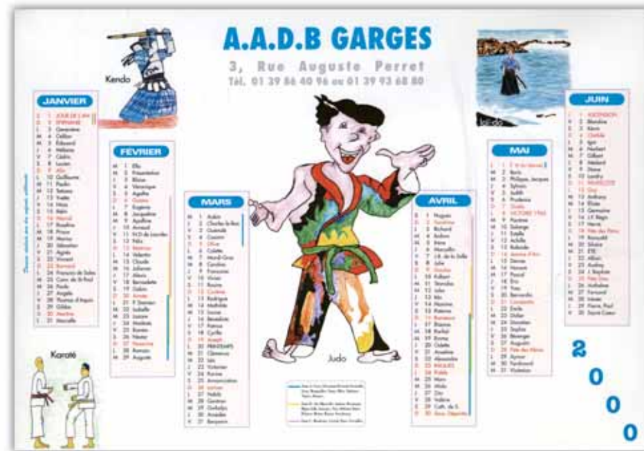
Calendrier de l'Association animation Dame Blanche.