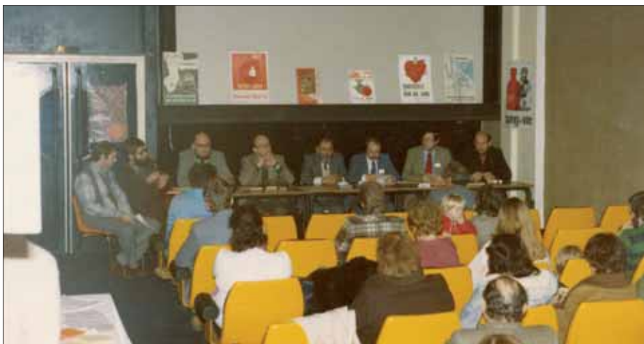
Assemblée générale de l'Association des donneurs de sang bénévoles, 1980.

Les associations pensent à garder les photographies des événements publics qu'elles organisent ou auxquelles elles participent. Mais il est recommandé de prendre aussi des clichés des assemblées générales, des fêtes entre membres, des préparatifs à une journée portes ouvertes et de tous les moments forts de la vie interne de l'association.