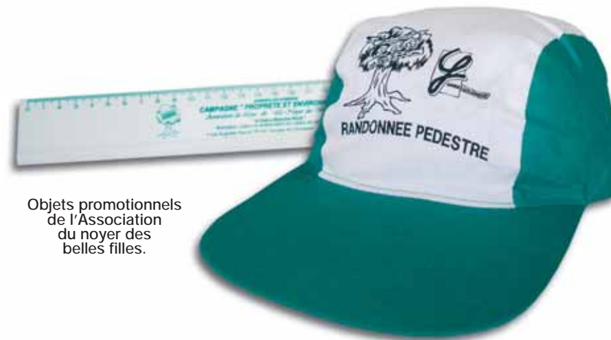
Objets promotionnels de l'Association du noyer des belles filles.