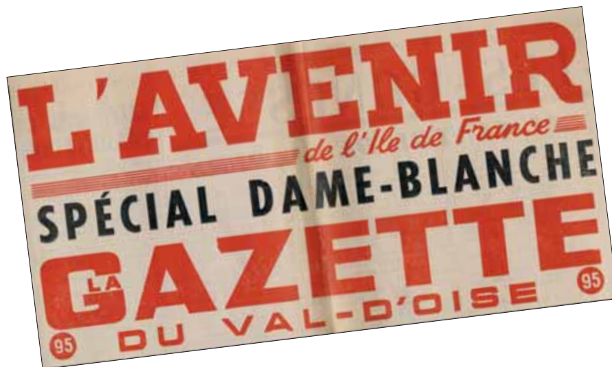
Supplément associatif au journal local La Gazette , septembre 1971.

Pour valoriser son patrimoine et raconter son histoire, les moyens sont nombreux : publications (brochure, bulletin spécial, article dans une revue), réalisations audiovisuelles (vidéo, diaporama) ou multimédia (site Internet, cd-rom), expositions (documents d'archives, arts plastiques), émissions de radio locale, rencontres (conférence-débat, soirée-mémoire), etc.